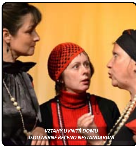
VZTAHY UVNITŘ DOMU JSOU MÍRNĚ ŘEČENO NESTANDARDNÍ