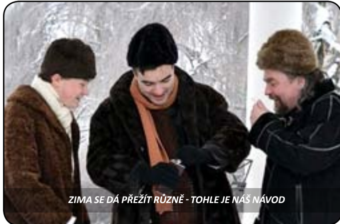
ZIMA SE DÁ PŘEŽÍT RŮZNĚ - TOHLE JE NÁŠ NÁVOD

Pokud přesto potřebujete trochu povzbudit, je tu náš kurýr