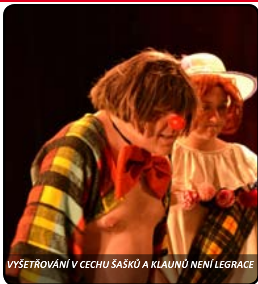
VYŠETŘOVÁNÍ V CECHU ŠAŠKŮ A KLAUNŮ NENÍ LEGRACE

Na hřbetě veliké A'Tu-in stojí čtyři sloni, kteří na svých zádech nesou Zeměplochu. Poznáváte? Volný cyklus cca 50 knih britského autora Terryho Pratchetta pro divadlo upravil jeho rodák Stephen Briggs a do češtiny fenomenálně přeložil Jan Kantůrek. Divadýlko se pokusilo uchopit titul Muži ve zbrani již vloni. První fantasy počín Divadýlka na dlani postoupil na celostátní přehlídku, kde získal dvě ocenění. Tak se usadte na svá sedadla v Zeměploše, objednejte si něco u Kolíka Aťšepicnu, ale opatrně, abyste to přežili.