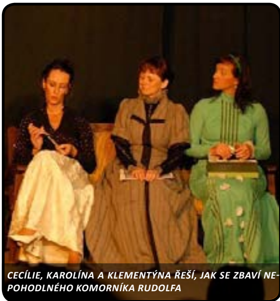
CECÍLIE, KAROLÍNA A KLEMENTÝNA ŘEŠÍ, JAK SE ZBAVÍ NEPOHODLNÉHO KOMORNÍKA RUDOLFA