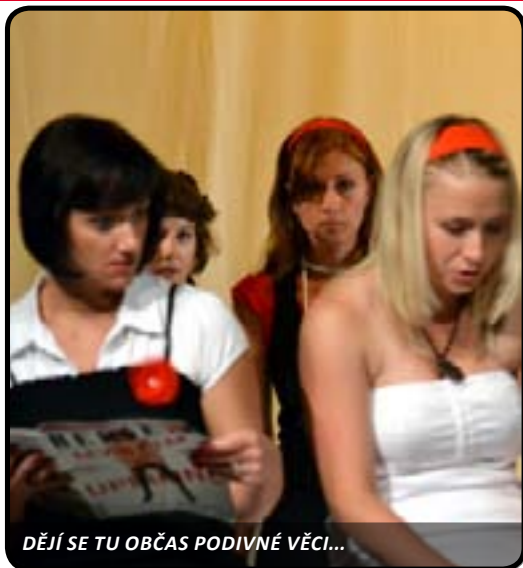
DĚJÍ SE TU OBČAS PODIVNÉ VĚCI...