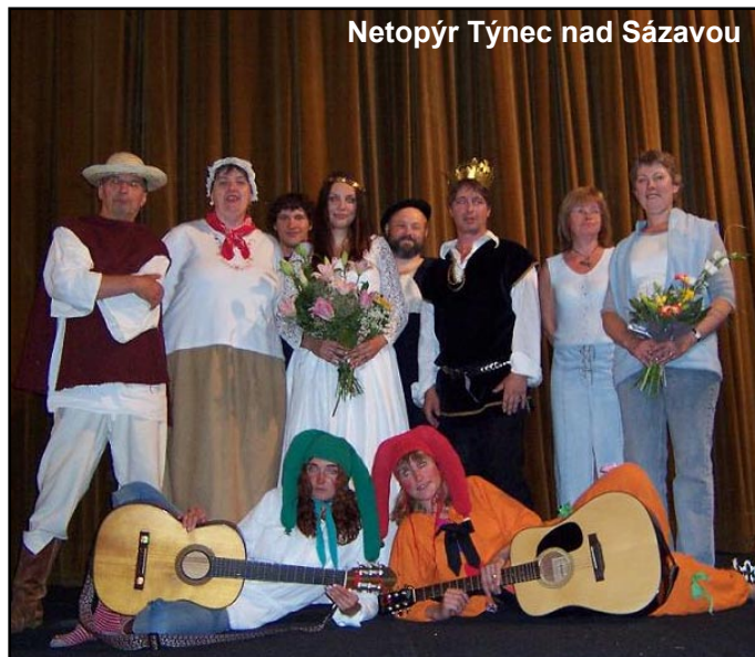
Netopýr Týnec nad Sázavou

Kdo by neznal pohádku Jana Wericha. A navíc, kdo by neznal dívku oděnou jen v rybařské síti. Pro mnohé tatínky je to jen sen, nic než pohádka. Ruku na srdce, kdo by odolal bosé dívce na koloběžce. Ovšem zde nepůjde o představení pouze a výlučně pro tatínky, ale právě pro vaše ratolety. A jestli náhodou nevíte, jak to bylo doopravdy s mladou královnou, přijďte se podívat na představení souboru Netopýr z Týnce nad Sázavou.